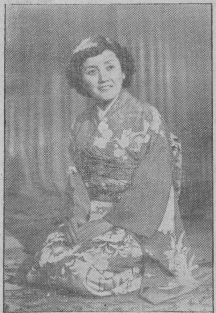
Paisajes bellos los de Japón. Alma sensible y delicada la japonesa. Finura y refinamiento en el arte. Sonrisa eterna en los labios, obscuridad en la mente y angustia en el corazón de un pueblo grande y noble pero que desconoce a Dios.

En las estaciones, el paso de rosca es mucho más delgado, a fin de que los trenes pasen más lentamente por ellas—a unos 60 centímetros por segundo—para permitir al público que se suba o se baje de los coches.