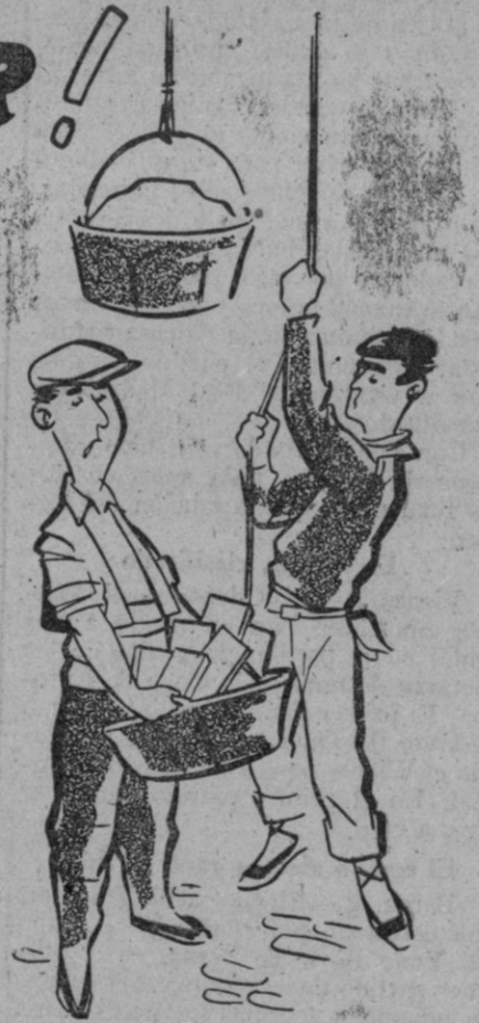
Se fabrican en varios tamaños