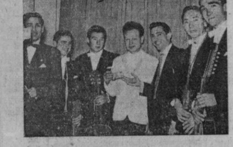
El formidable conjunto «Santa Fe» fue proclamado vencedor del grupo segundo