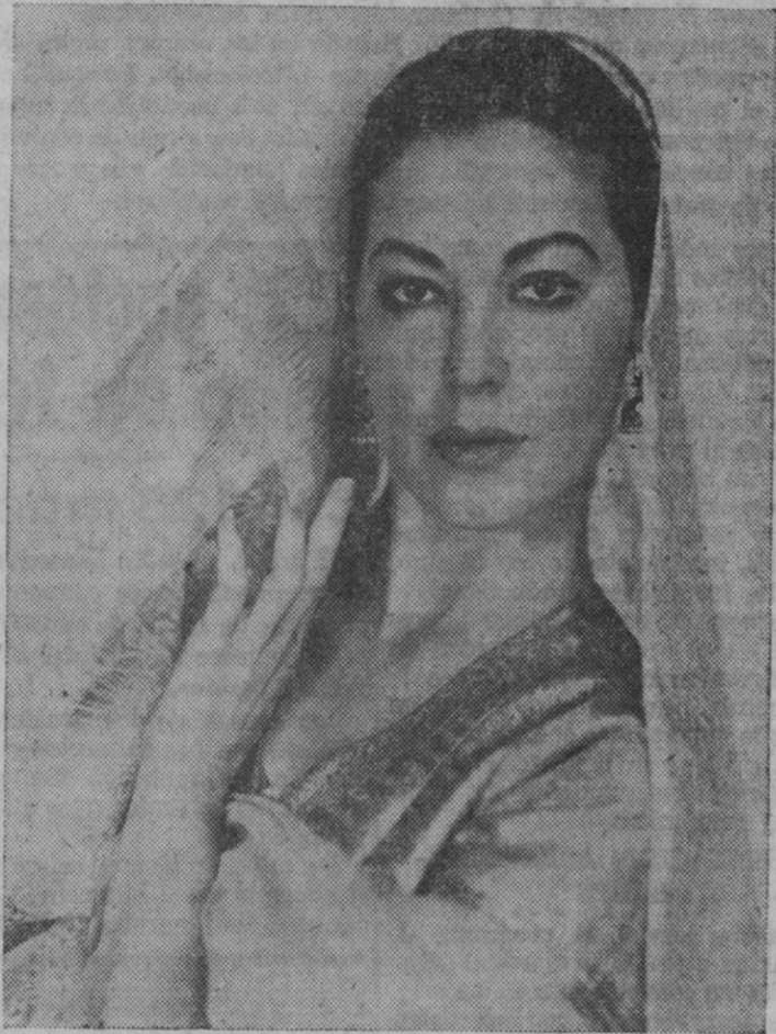
Ava Gardner en "Cruce de destinos"

Una vez el director George Cukor había elegido Lahore, al oeste del país,