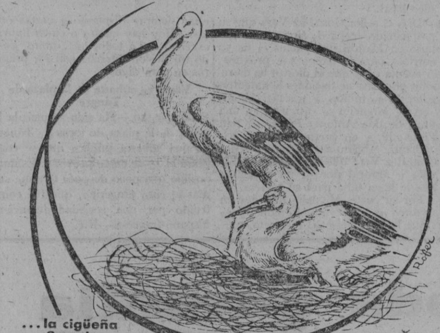
... la cigüeña prefiere las torres de los campanarios.