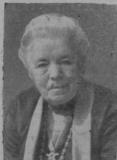
Selma Lagerlöf, la célebre novelista sueca, que cumple hoy cien años de edad. Selma fue galardonada con el Premio Nobel de Literatura en el año 1909.