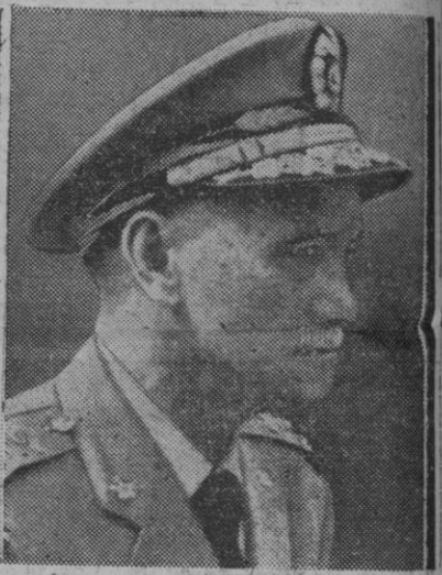
El mariscal Chiang Kai Chek, presidente de la República nacionalista china en Formosa

El almirante declaró a su llegada que la situación es todavía «muy grave», pese a los progresos realizados en las negociaciones de Varsovia para llegar a un alto el fuego en Quemoy.—Efe.