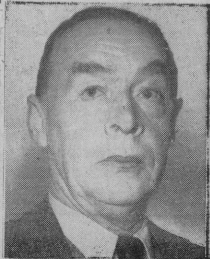
Erich Maria Remarque, célebre autor alemán que ha cumplido sesenta años el pasado domingo, día 22