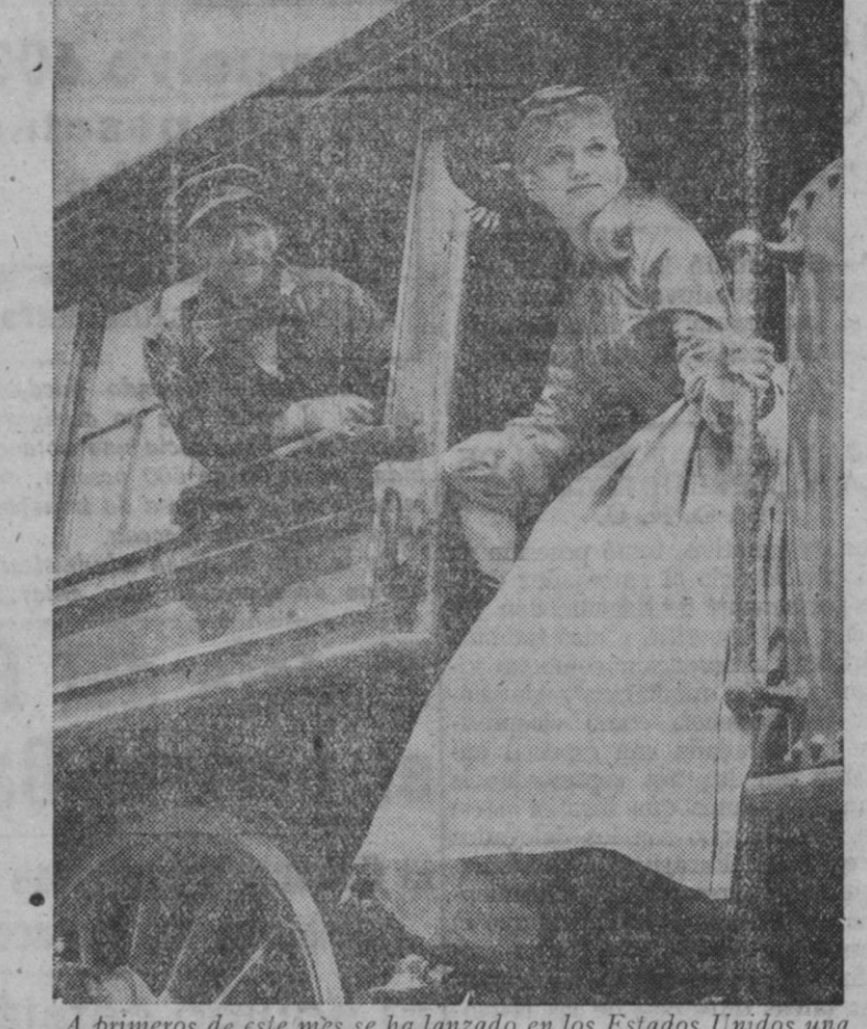
A primeros de este mes se ha lanzado en los Estados Unidos una película cuya grandiosidad es tan sólo comparable a "Lo que el viento se llevó" y en la que han estado trabajando durante varios años. Se titula "El árbol de la vida" y en inglés "The Raintree County". Son protagonistas de la misma Montgomery Clift, Elisabeth Taylor y Eva Marie Saint, que aparece en esta foto, en una locomotora que funcionó durante la guerra civil. Metro Goldwyn Mayer rodea dicho film de todo el fausto e importancia que en realidad tiene