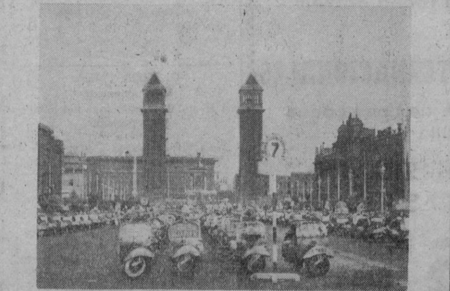
Delante de la exposición de Montjuich se celebró la santa misa para los 2.500 participantes

El tambor del Bruch ha sonado, pero esta vez gozoso del ejército de buena voluntad que es el vespismo. (De nuestro enviado especial, In terin.)