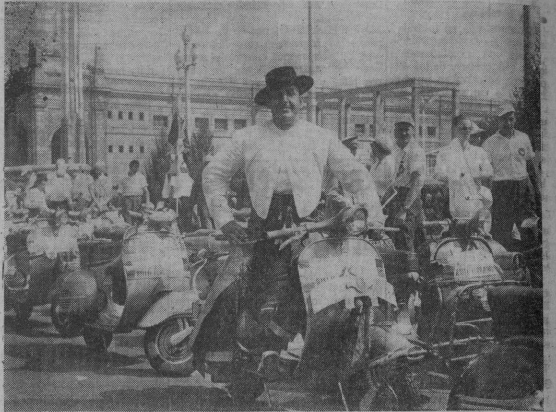
También Andalucía estuvo representada en el maravilloso desfile por las calles catalanas, que fué ovacionado por miles y miles de personas

Las «Vespas» rodaron 4.200.000 Km., confirmándose como vehículo