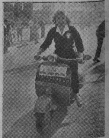
Una vespista alemana, que hizo 2.000 kilómetros para asistir al "EURO-VESPA"

En la Plaza Mayor se habían colocado las mesas, y en medio, sobre un gran tablado, se exhibía nuestro in-