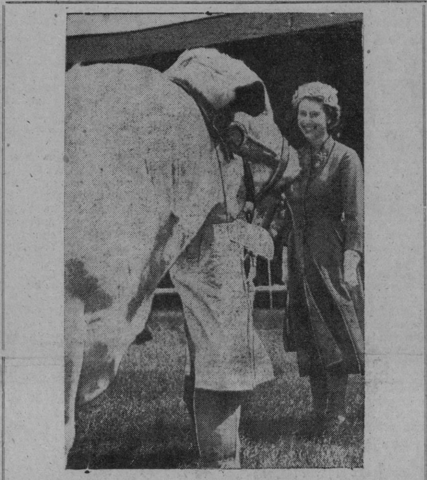
Su Majestad la reina Isabel II, contemplando una de las reses premiadas en la Real Exposición Agropecuaria, que organiza anualmente la Royal Agricultural Society de Inglaterra, y fue celebrada recientemente en Norwich

Por otra parte, un portavoz de la Liga Árabe dijo que los llamamientos del imán han ido entregados a todos los representantes de las naciones de la Conferencia de Bandung en El Cairo. Las veintinueve naciones que estuvieron representadas en la Conferencia afroasiática de Bandung son las siguientes: India, Pakistán, Ceilán, Birmania, Indonesia, China comunista, Costa de Oro (ahora Ghana), Turquía, Japón, Egipto, Etiopía, Persia, Iraq, Jordania, Líbano, Libia, Arabia Saudí, Siria, Yemen, Camboya, Laos, Afganistán, Liberia, Nepal, Filipinas, Sudán, Tailandia, Vietnam del Norte y Vietnam del Sur.—Efe.