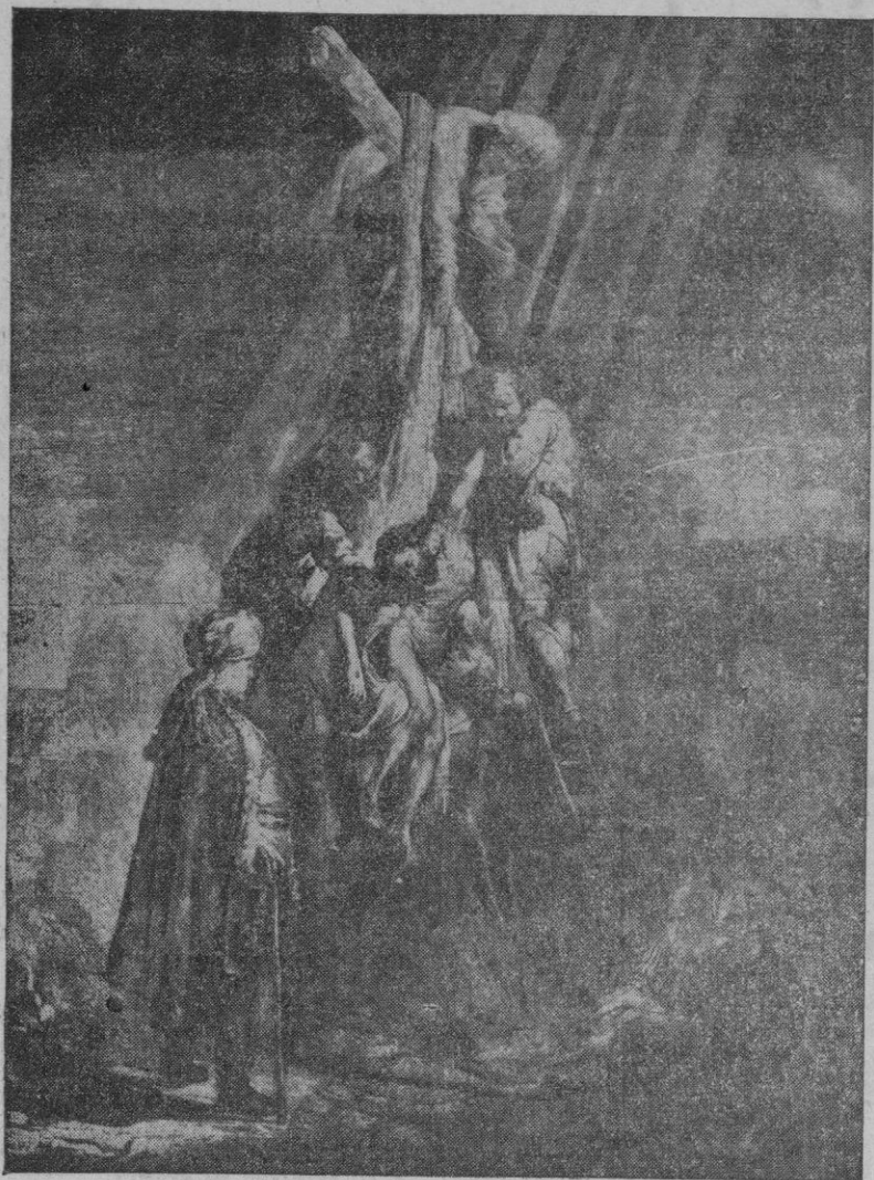
Con el nuevo orden establecido por Su Santidad el Papa para la Semana Mayor, el Sábado Santo vuelve a convertirse en un día alitúrgico, recobrando su antiguo carácter de riguroso luto, por la muerte del Señor.