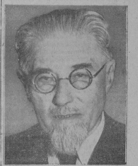
Paul Ramadier, nuevo ministro de Finanzas en Francia