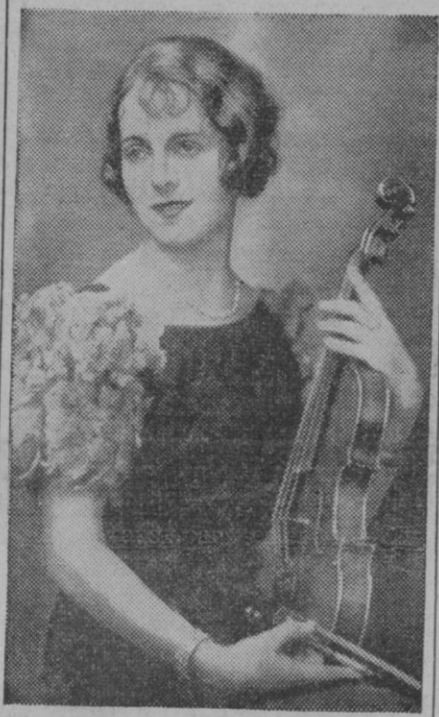
Hubo una época en que todas las familias querían que sus hijas, o alguna de ellas, estudiaran música. ¿Por qué? ¡Ah!, cosas de la vida.

Paris, 20. (Urgente).—El Gobierno francés se ha puesto de acuerdo, al parecer definitivamente, acerca del plan de Edgar Faure relativo a la zona francesa de Marruecos.—Efe.