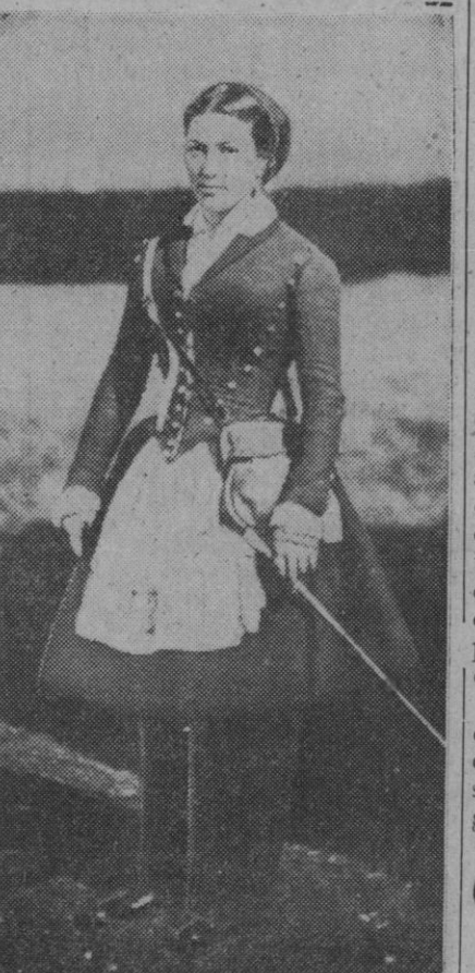
El grabado tiene sabor añejo. Pero a pesar de ello, no ha perdido el encanto y la gracia que le da la presencia de una figura femenina. Una figura que es una cantinera francesa, ataviada con traje típico, de allí por los años 1855-1856. Como verán, efectivamente, el sabor rancio existe.

Seguidamente, el de Hacienda dijo que la condecoración le llenaba de alegría y de agradecimiento al ver cómo los ingenieros agrónomos y de Montes, los ayudantes y los peritos agrícolas, cuando vieron convertidas en ley las normas que rigen la realización del Catastro en España, adoptaron el acuerdo de pedir al ministro de Agricultura y a los compañeros del Gobierno que asistían al acto la propuesta de la concesión de la condecoración. Por último, dijo que el ministro de Hacienda no dejará de apoyar todas las pretensiones que intente el señor Cavestany para el mayor engrandecimiento de la agricultura.