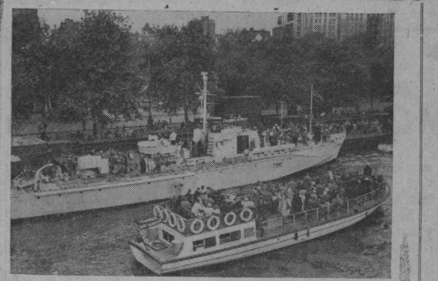
¿Les gusta el mar? ¿Quiéren dar una vueltecita bien en la motora, bien en el torpedero que les presentamos? Pues ¡hala! animarse y adelante. Por nosotros no hay inconveniente alguno. Pueden empezar. Nosotros, por ahora, preferimos quedarnos en tierra... con algo de agua de vez en vez, pero del botijo.

Detroit, 9.—La General Motors está construyendo un nuevo tren ligero y rápido, que será terminado, a más tardar, este año. Estará movido por una sola locomotora Diesel, con una turbina de mil doscientos caballos. Puede llevar cuatrocientos pasajeros y hacer una velocidad de más de ciento sesenta kilómetros por hora, consumiendo de tres a cuatro litros de combustible. Su costo es de dieciséis millones de pesetas.