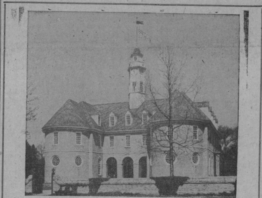
El Capitolio de Williamsburg, sede de la Cámara de diputados, que fué el primer cuerpo legislativo del hemisferio occidental. Los legisladores se reunían en el ala derecha del edificio y allí se prepararon y formularon algunas de las leyes que posteriormente sirvieron de base a la Declaración de independencia y a la Constitución de los Estados Unidos