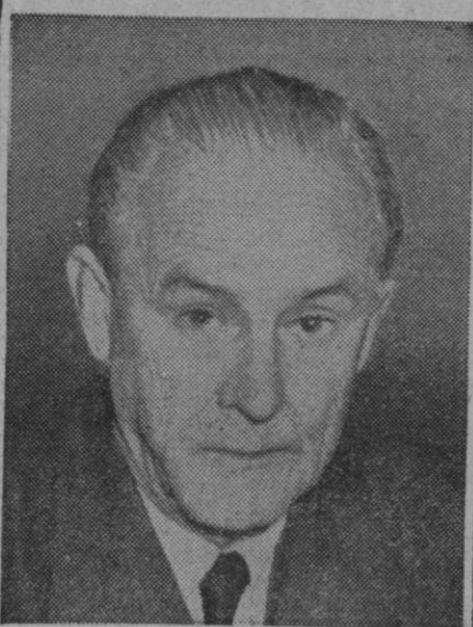
Clement Davies, jefe del grupo parlamentario del partido liberal inglés, que acaba de ser propuesto como candidato al Premio Nobel de la paz para 1955.

Presidente de la Unión Mundial de Parlamentarios para un Gobierno mundial, Davies ha hecho un gran esfuerzo para conservar la paz y en pro de la causa de desarme y la creación de un sistema universal para internacionalizar el derecho y la justicia.