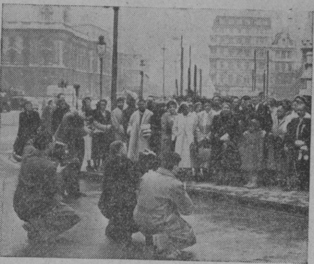
Los «bellos» y las «bellas» también hacen turismo. O por lo menos sus representantes. Estos lo son de varias escuelas de belleza norteamericanas, que se retratan frente al Parlamento de Londres, durante su visita a otras tantas casas de ídem londinenses.

Con dicha enmienda fué retirada también una segunda, por la que se tendía a que se llevaran a cabo negociaciones sobre la manera de aplicar los acuerdos, y que tales negociaciones se celebrasen antes de la ratificación.