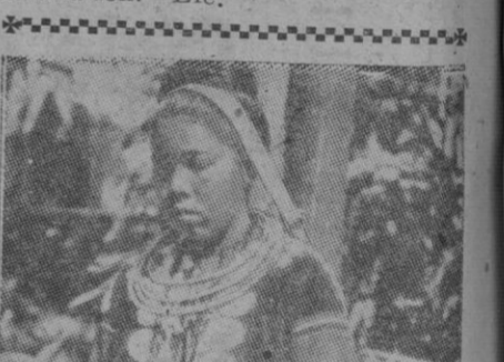
Una joven birmana que se dirige al mercado. Y aunque no lo parezca, su trajecito vale un dineral. Lo lleva adornado de joyas de plata y los collares son del mismo metal. La bolsa para la compra va a la espalda, pendiente de la cabeza mediante una cinta. ¿Conjianza? ¿O es que allí roban cara a cara?

Túnez, 2.—El Bey ha dirigido al pueblo tunecino un llamamiento a la calma. Da así el Soberano nuevas seguridades de la satisfacción que le produce el programa ofrecido hoy por Mendes-France y ya en vías de realización.—Efe.