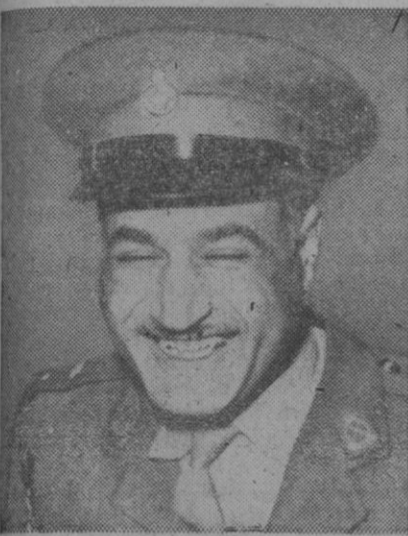
ABDEL NASSER, primer ministro egipcio

El Cairo, 30 (4 t.).—Se declara de fuente autorizada que la Hermandad Musulmana ha decidido oponerse al acuerdo de Suez entre Egipto y Gran Bretaña.—Efe.