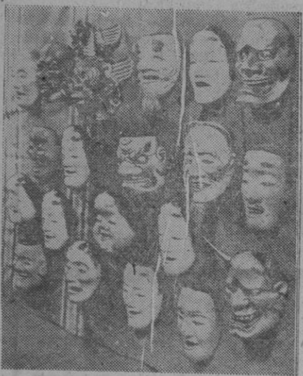
En Japón, como en todas partes, son amigos de disfrazarse de vez en cuando con motivo de cualquier fiesta. Para ello utilizan también caretas, en las que reproducen los rostros de los principales personajes nipones, como en éstas que vemos en el grabado

Todas las emisoras radian información dando cuenta del estado real del diestro que tenía a primera hora de la tarde treinta y ocho grados de fiebre y está más amodorrado, preparándose un intenso tratamiento de penicilina.