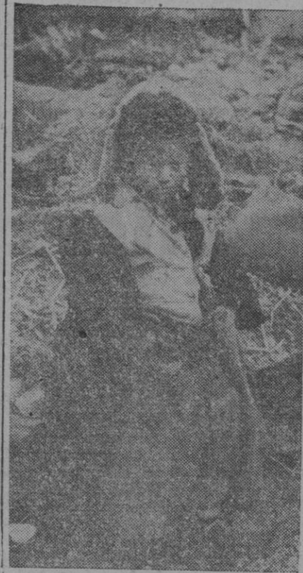
La guerra tiene muchos nombres: Corea, Indochina, etc., pero las consecuencias suelen ser parecidas si no las mismas. Y muchas veces los pequeños son quienes pagarán las consecuencias, con toda una vida falta del cariño y calor de un hogar, en el que faltan los nombres de los padres.

Londres, 24 (4 t.).—El periódico «Daily Herald», laborista, asegura que sus redactores han visto en Londres algunos automóviles norteamericanos con la siguiente inscripción: «No me echen ustedes la culpa; yo voté a los demócratas».—Efe.