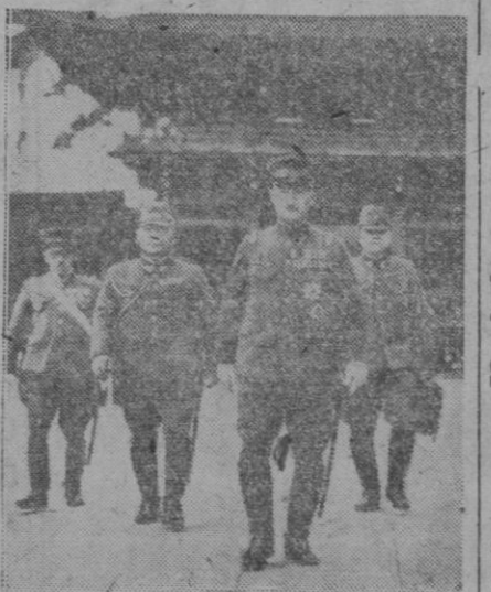
Militares japoneses de otros tiempos cuya estampa nos recuerda el hecho de que se está tratando ahora, ante el constante peligro de la agresión, de permitir al Japón aunque nada más sea que un pequeño remedo de su antiguo y poderoso ejército.

Yssingeuax, 24 (4 t.).—El primer puerto puntuable para el Gran Premio de la Montaña en la etapa de hoy, el Pertuis, de 1.026 metros de altura, tercera categoría, ha sido coronado en primer lugar por Barnajo (Oeste) y en segundo lugar por Bahamontes. Un minuto y 15 segundos después, el suizo Clari, seguido de Van Genechten, Dotto, Lucien Lazzaris, Vittetta, Låuredi, Forestier y Demulder. A dos minutos el pelotón en el que figuran Bovet y Kubler.—Alfil.