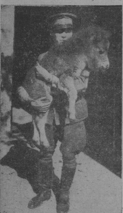
Así se va más contento para el cuartel. Este soldado japonés piensa ya en darle un buen bocadito a la carne del animal transformado en uno de los mejores platos para el día de fiesta y así, naturalmente, camina hacia el cuartel con mejores ganas que cuando les espera únicamente el consabido arroz

Palma de Mallorca, 4.—El yate «Presidente Trujillo» ha llegado a este puerto. A su bordo viajan los familiares de su excelencia el generalísimo dominicano, los cuales se proponen realizar diversas excursiones por Mallorca.—Efe.