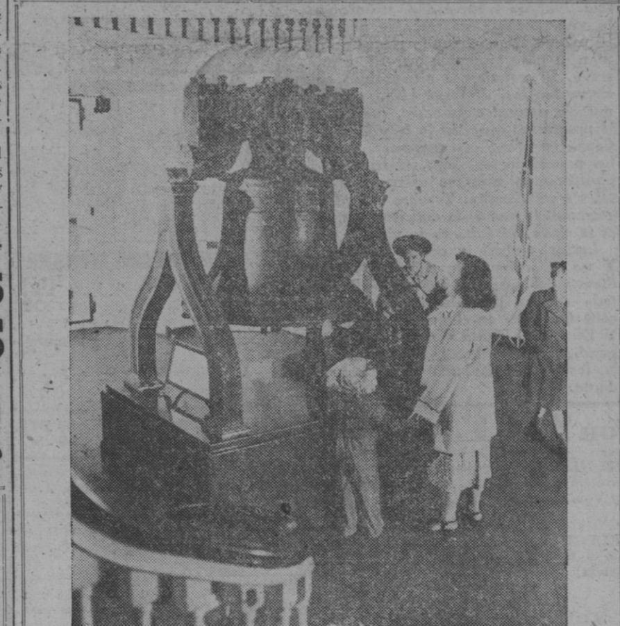
Uno de los símbolos más conocidos de la libertad en los Estados Unidos, cuya independencia celebra ahora un aniversario más, es probablemente la Campana de la Libertad, que se conserva en el Palacio de la Independencia, en Filadelfia (Pennsylvania). En esta fotografía de primer plano de la campana aparecen algunas de las personas que van a verla anualmente a millares, especialmente el día 4 de Julio. Fundada primitivamente en Inglaterra, la Campana de la Libertad fué vuelta a fundir varias veces en los Estados Unidos. Mientras repicaba en 1835 con ocasión del entierro de John Marshall, presidente del Tribunal Supremo de los Estados Unidos, la famosa campana, que siempre había sido frágil, se rajó de nuevo, y desde entonces no ha vuelto a sonar

Hong Kong, 3 (4 t.).—El diario «Kun Sheung» anuncia que el 27 del pasado mes se produjeron graves desórdenes en la provincia china de Kiangsu. La Policía comunista intervino y mató o hirió a más de un centenar de campesinos que protestaban contra la escasez de víveres.—Efe.