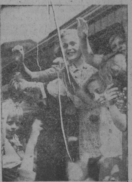
Alegres viajeras, estas niñas sonríen diciendo adiós a sus papás que las despiden en la estación. Para ellas llegaron ya las vacaciones veraniegas y marchan alegres a la ciudad de Iona, que las espera, para pasar un verano delicioso.

El candidato demócrata a la presidencia en 1952, dirigiéndose a los miembros de su partido, dijo que la situación del país «era demasiado peligrosa para festerse que alegrar de ello.»—Efe.