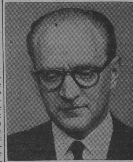
Guy Mollet, nuevo presidente del Consejo de Europa

A las doce y cuarto abantalaron la sala de espera. La multitud que llenaba todo el recinto de la estación y el paseo de la Florida prorrumpió en vítores y aclamaciones entusiastas. Los miembros de la colonia dominicana en Madrid se agrupaban en torno a las pancartas que la Asociación de Estudiantes Dominicanos y dicha colonia portaban para dar la bienvenida al ilustre benefactor de su patria. Entre aclamaciones y aplausos (Continúa en la página 3)