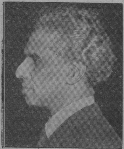
Krishna Menon, representante indio en las Naciones Unidas, que trata en la Conferencia de Ginebra de servir de mediador en la guerra de Indochina