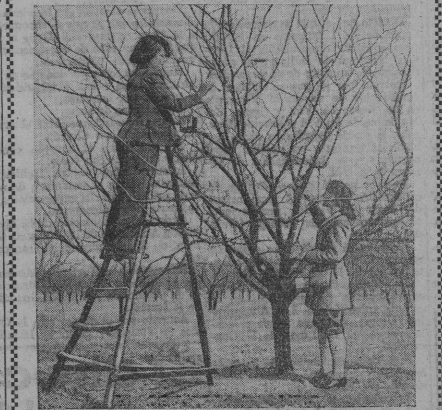
Han brotado los árboles con la primavera y estas jovencitas con atuendo un tanto varonil y exótico se entretienen en examinar el arbolado de su finca, en lucha siempre con la infinidad de parásitos y enfermedades que pudieran traer graves consecuencias a la hora de recolectar el fruto