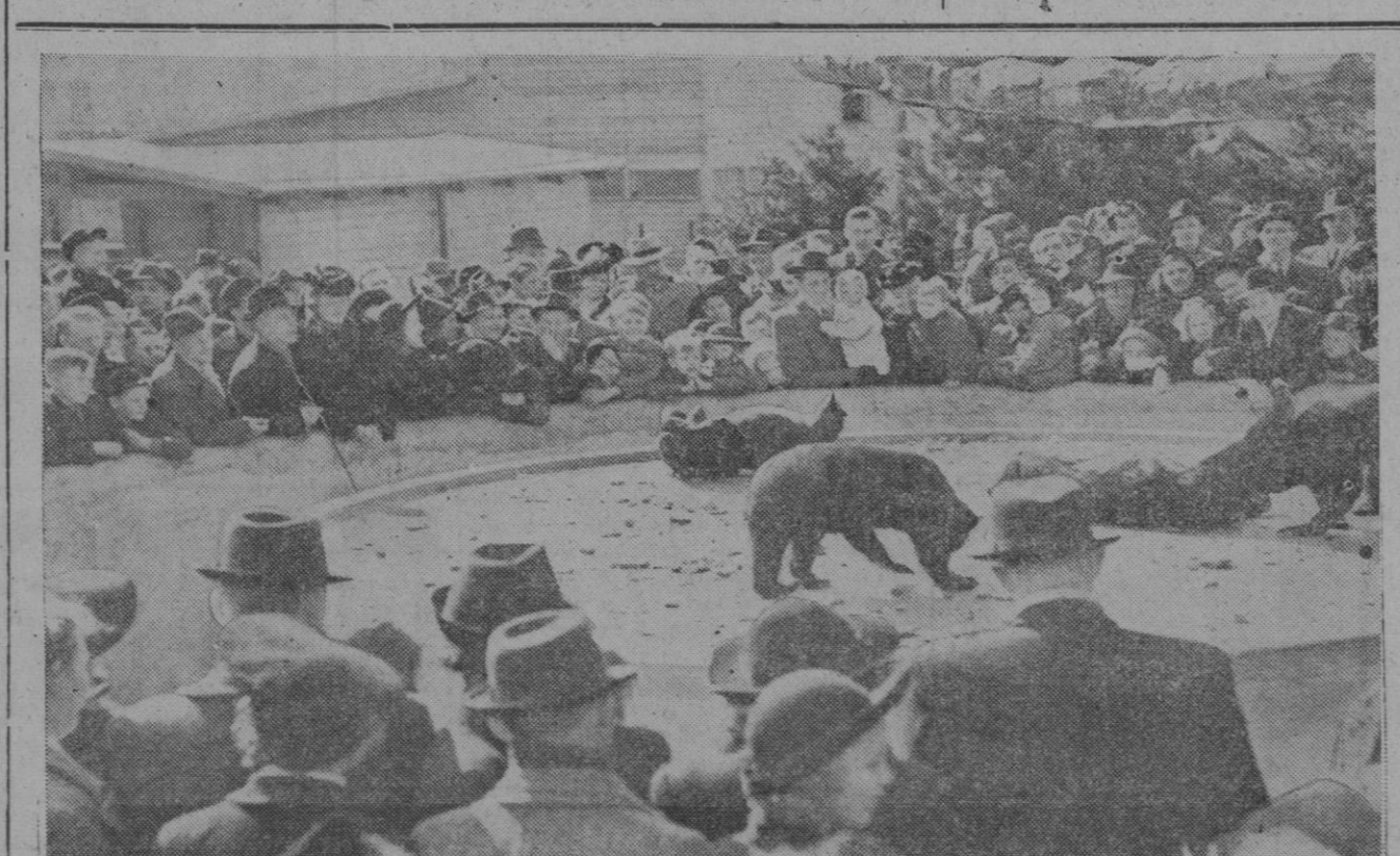
Mañana de domingo en el "zoo". Es invierno pero hay un sol alegre, propio de la fiesta y bueno para la expansión, el optimismo y el descanso. Alegres están también los cachorros ya mayorcitos, los juguetones osos pardos que gozan y se zarandean ante el regocijo de los visitantes. La escena es en Copenhague

Washington, 1 (4 t).—Un técnico en alimentación, Norris Dodd, ex director general de la Organización de Agricultura y Alimentación de las Naciones Unidas, y que fué subsecretario de Agricultura en la Administración Truman, ha criticado hoy a los Estados Unidos por subvencionar la alimentación de cerdos con leche en polvo sobrante, en vez de proporcionarla a los niños extranjeros que mueren por falta de alimentos.—Efe.