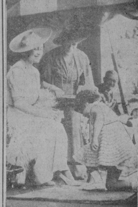
Si, la niña está muy guapa, parece oírse de los labios de las dos señoras que contemplan risueñas a la pequeña, mientras ella quiere verse a sí misma con su nuevo vestido, y lo hace de todas las posturas para no perderse ni el más mínimo detalle.