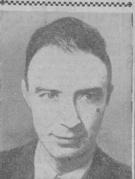
Este es el doctor Robert Oppenheimer, uno de los principales sabios de las investigaciones atómicas en los Estados Unidos, que ha sido destituido de todos sus cargos, por supuestas relaciones con el partido comunista.