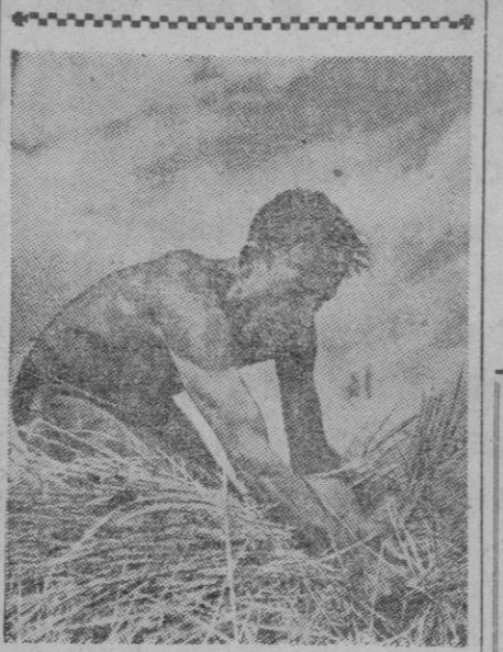
Tras las fatigas del laboreo de la tierra, siembra y demás operaciones agrícolas, la esperanza de la cosecha y las fatigas también y sudores de la recolección. La escena es en América, pero lo mismo pudiera ser en los áridos y amarillentos campos de Castilla. Dentro de pocos meses esta estampa volverá a sernos familiar por el ancho y dorado mar de mieses castellanas.

COMIENZA EL DESFILE Poco después de las doce de la mañana comenz6 el desfile. Abri6 marcha una secci6n de motoristas que precedía al capitán general de la primera regi6n, teniente general Martín Alonso, que ocupaba un jeep sobre el que iba en pie, seguían el jefe de su Estado Mayor, el jefe de Artillería del Cuerpo de Ejército de Guadarrama y los restantes miembros del Cuartel general de la primera regi6n.