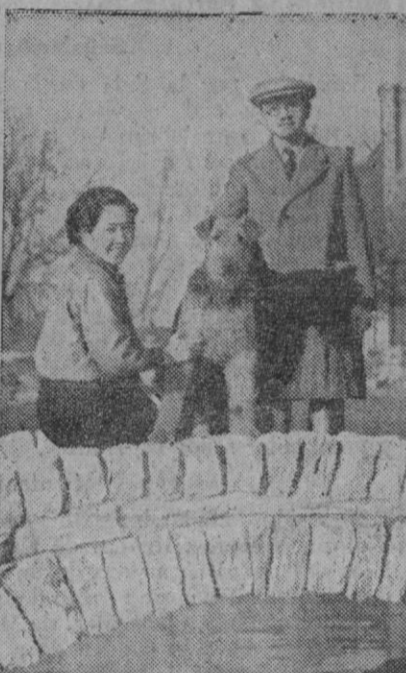
Fotografía familiar. Aunque, naturalmente, el perro no forma parte integrante de la familia, en el verdadero y noble sentido de la palabra, empero el animalillo es "casi" un miembro más. Por ello, sus amos no han tenido reparo en fotografiarse junto a él. Y el can, tan contento y ufano, mira retadoramente al objetivo.