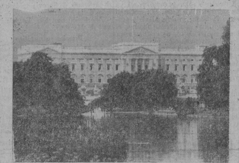
He aquí una primorosa perspectiva del palacio inglés de Buckingham tomada desde el parque de San Jaime. Sobre los árboles surge imponente la gran mole del histórico palacio británico, luciendo sus sugestivas líneas arquitectónicas.