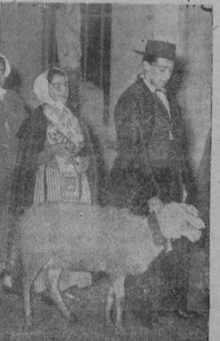
Esta pareja, vistiendo esos atuendos, muy bien podrían estar interpretando, en algún escenario, una comedia de ambiente rural. Eso del rural lo decimos, claro está, porque con la inclusión en el cuadro, de esa oveja, no podemos suponer que se dirijan a un baile de gala. Aunque, si no estuviese el animalito, acaso lo diríamos.