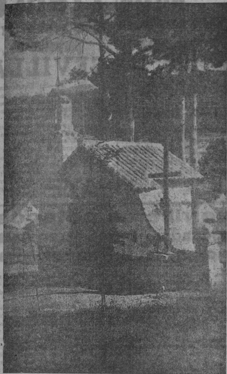
Capilla del Campamento