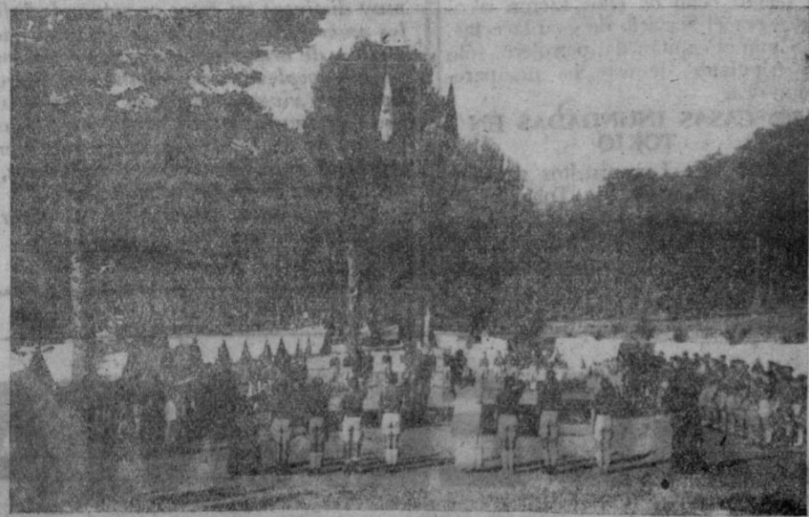
Acto de arriar banderas

«La labor que está realizando el Frente de Juventudes es una labor lenta, pero cuyos frutos son seguros. El concepto de Patria, de justicia, de disciplina, de sacrificio, hermanados con el concepto de Dios, son ideales que sienten y vive nuestra juventud, y que en un futuro próximo darán con toda seguridad espléndidas realidades»