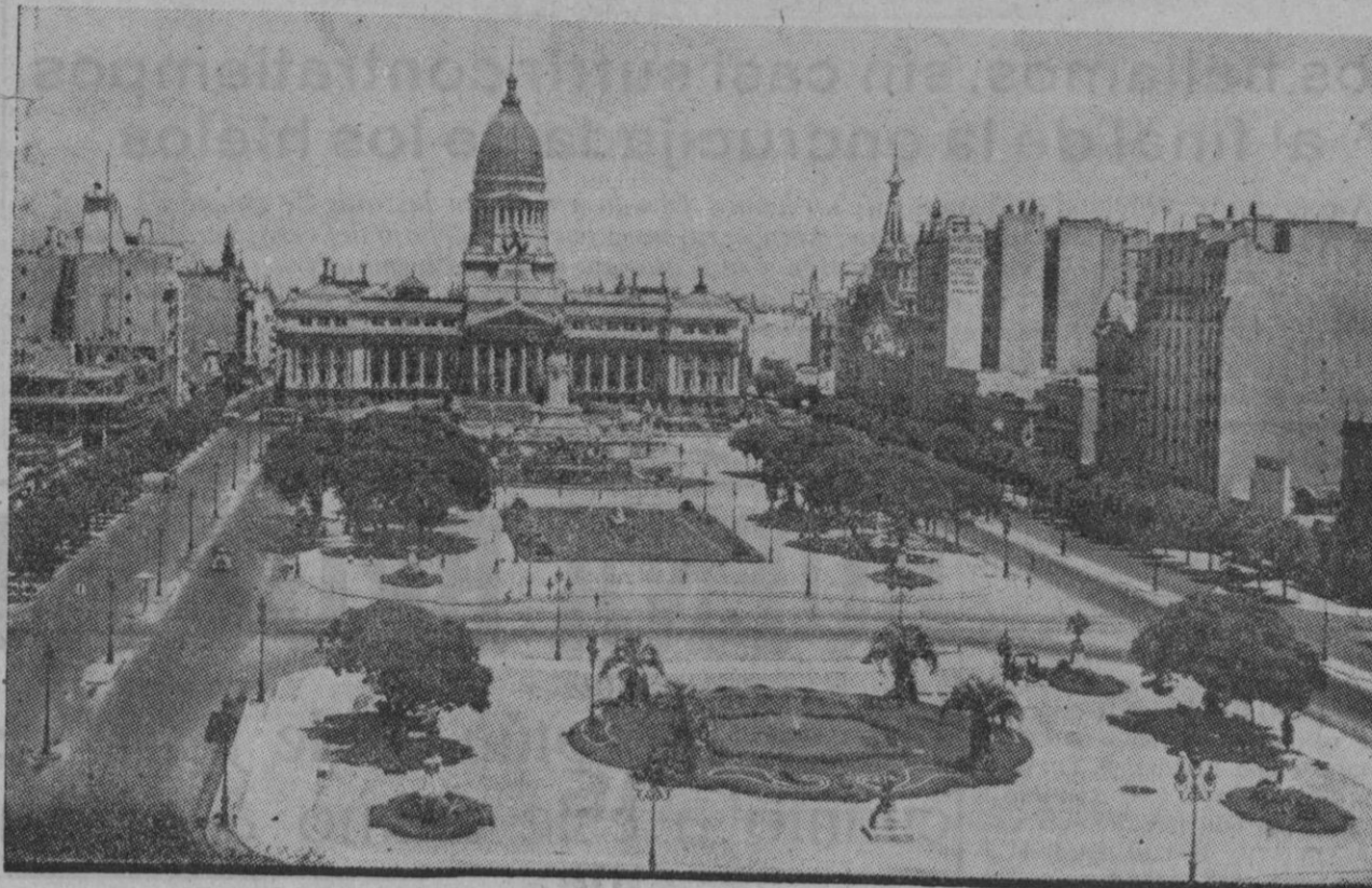
La belleza y armonía de los jardines y avenidas de la plaza del Congreso, de Buenos Aires, es el marco perfecto y adecuado para las líneas clásicas del Parlamento, que aparece al fondo. Hoy estos paseos son testigos de violentos actos de terror que tienen sobresaltado al pueblo argentino, que está viviendo días de agitación política

Los periódicos argentinos no publican noticias de las agencias norteamericanas