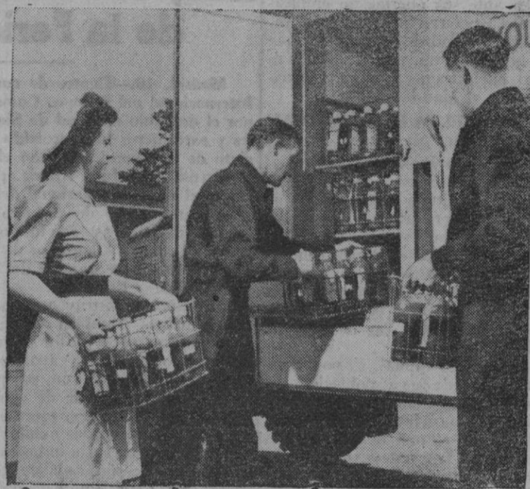
La transfusión de sangre, servicio organizado durante la última guerra mundial, ha quedado como labor permanente en la obra de la paz. La fotografía nos muestra un equipo de transfusión dedicado a la tarea de depositar en los refrigeradores la sangre de los voluntarios donantes.