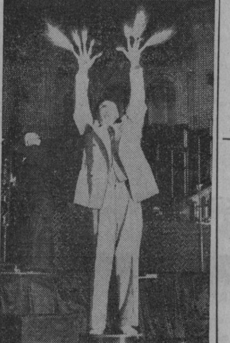
No sabemos si será cierto o no. Pero nos envían esta fotografía de un fenómeno que, subido en su base de cobre, deja pasar por su cuerpo un millón de voltios. Esta es la razón de las aureolas luminosas que se le forman al final de los dedos al experimentar que soporta incomprensiblemente esa carga.