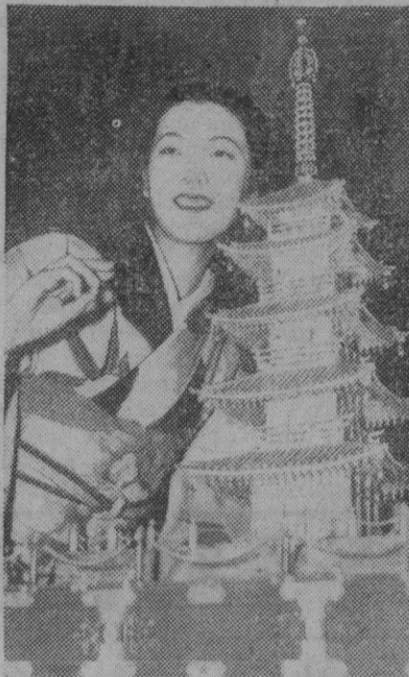
Arte y valor se reúnen en esta admirable joya, reliquia de una pagoda china. Está constituida con 25.000 perlas japonesas y valorada en 125.000 libras esterlinas.