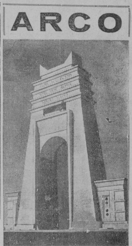
Este gran arco de triunfo, de mármol, está en el camino de Trípoli hacia la frontera de Egipto. Fué inaugurado por Mussolini durante la visita que hizo a Trípoli.

Venecia, 28.—Las campanas de San Marcos y de todas las iglesias de Venecia anunciaron al pueblo, con su doblar, la muerte de su patriarca, el cardenal Agostini, cuyo cadáver permanecerá expuesto en su palacio hasta el martes, día en que, en góndola funeraria, será trasladado al desembarcadero de la plaza de San Marcos e introducido en la catedral, donde estará expuesto hasta el jueves, día señalado para el entierro.