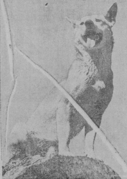
El «dingo» o perro salvaje de Australia es uno de los mejores ejemplares de la pobre fauna de este país. Es muy parecido a los animales que viven en el mismo estado salvaje de libertad en la India. Los australianos le persiguen con la misma saña que nosotros perseguimos a los lobos, por lo cual ha quedado muy reducida la especie en las regiones habitadas de Australia.