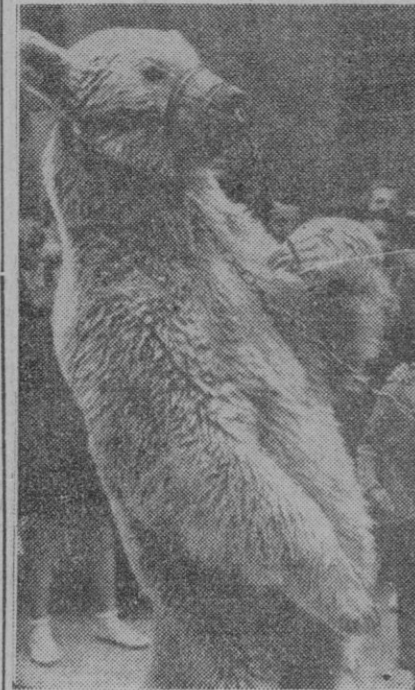
Este osezo baila con su típica pesadez, admirando al público infantil que le contempla. Según nuestras referencias, fácilmente confirmables por su aspecto, es también un niño en su especie y le espera una brillante carrera en este arte.

Nueva York, 17.—El presidente electo y el general Mac Arthur se han reunido en un almuerzo en casa del futuro secretario de Estado, John Foster Dulles, anuncia el secretario de Prensa de Eisenhower, James Hagerty. Así, a los tres días del regreso de Extremo Oriente del presidente electo, éste se ha reunido con su antiguo jefe para conocer la solución que aconseja para el conflicto coreano. La reunión es la primera que celebran los dos militares desde que, en 1946, Eisenhower, como jefe del Estado Mayor conjunto, visitó en Tokio al entonces comandante supremo en Extremo Oriente.—Efe.