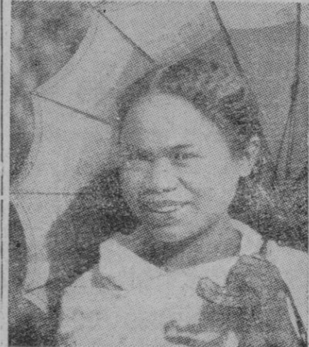
Se trata de una belleza de Madagascar. Todo son puntos de vista. Al fondo, la sombrilla. Ninguna mujer de Madagascar sale de casa sin sombrilla para protegerse del sol y es quizá la prenda más estimada por los indígenas.

Gobernación destacó la importancia de la reunión, de la cual, naturalmente, no habría de surgir inmediatamente la fórmula mágica para realizar plan de tanta trascendencia para Madrid, pero que, por lo pronto, había conseguido plantear un cambio de impresiones entre autoridades técnicas de singular importancia respecto a la ordenación de la capital. Terminada la reunión, el ministro de la Gobernación celebró con los periodistas una interesante conferencia en la que reiteró los anteriores argumentos e informaciones.