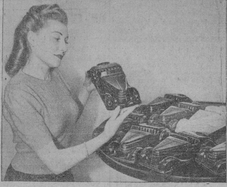
La industria británica de materias plásticas ha logrado producir, moldeados en una sola pieza, estos automóviles de plexiglás que constituirán la delicia de los pequeños, a quienes está destinada la producción de los mismos.