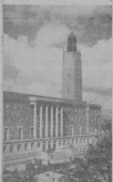
Este palacio pertenece a la ciudad inglesa de Norwich que aún no se ha reconstruido del todo de los últimos ataques en la guerra pasada.