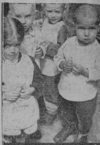
Estos niños rusos llevan la huella de las penalidades pasadas. Pertenecen a un asilo y en su cara se refleja todo el barbarismo que han presenciado. Ahora viven en Alemania, pero aun guardan en su mirada el recelo y la desconfianza ante todo lo que les rodea.