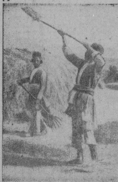
Irán, que está en la más reciente actualidad por su producción de petróleo es también país agrícola aunque no represente este aspecto una riqueza tan enorme como la del "oro negro". Aquí vemos a unos agricultores iraníes en plena labor, separando el grano de la paja, con arreglo a los procedimientos más rudimentarios.