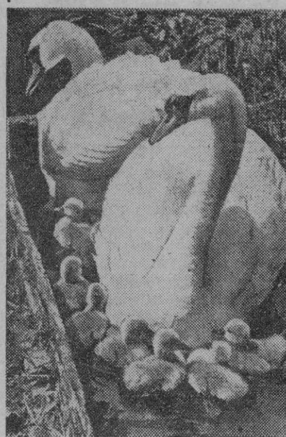
Una escuadrilla de patos avanza en un arroyuelo de Conway, donde abundan también los pequeños lagos y por lo tanto estas deliciosas escenas.