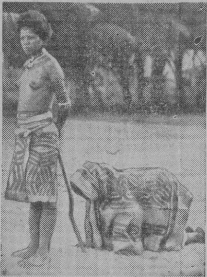
Lo que camina detrás de la indigena no es un animal. Se trata de una viuda, porque en Nueva Guinea han de caminar las mujeres que pierden el marido con pies y manos y con la cara tapada durante seis meses.