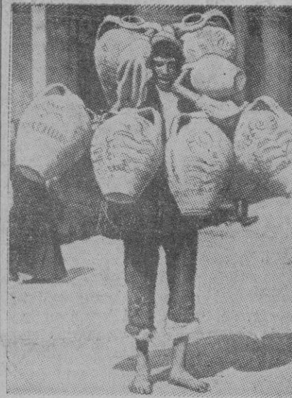
Este alfarero siciliano recorre las calles pregonando, como nuestros clásicos botijeros. Por ahora, las cosas van bien. Pero una caída puede ser fatal.