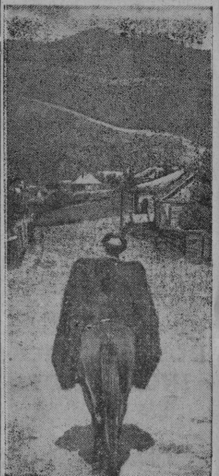
En el Cáucaso, las pequeñas aldeas son frecuentes, separadas por grandes distancias entre sí. El aspecto de este hombre sobre el tipo clásico de pequeño caballo, casi enano, es frecuente también. Pero el fondo de la fotografía es único; se trata del Monte Elbrus, con toda su grandeza.—Efe.

Londres, 7.—La revista dominical de más circulación en Inglaterra, el «Sunday Pictorial», ha comenzado a publicar una información en la que se debate los pros y los contras de las corridas de toros. El periódico invita a sus lectores a decir si asistirían a una corrida en caso de poder hacerlo. Al lado de las opiniones figura una página gráfica con escenas de la fiesta nacional española. Entre las primeras contestaciones hay para todos los gustos. Figuran algunas alusiones como las siguientes: Los matadores tienen un valor extraordinario. Una cornada puede matarles. Los pobres caballos sufren. Las corridas pueden compararse con el rodeo americano. El toro es martirizado. La carne de los animales sirve de comida para los pobres.—Efe.