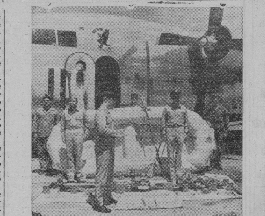
La unidad 443 de Transporte de Tropas norteamericanas va a trasladarse a Europa para reforzar los efectivos del Pacífico del Atlántico. Una de las tripulaciones de los C-119 Flying Boxcar con que cuenta aquella unidad es revisada por un oficial

Buenos Aires, 30.—El Gobierno ha decretado hoy el «Día sin carne» a la semana, dada la escasez de este producto. En el citado día se prohíbe a todos los hoteles, restaurantes y centros similares de todo el país que sirvan carne de vaca, cerdo, ternera, cordero u oveja.—Efe.