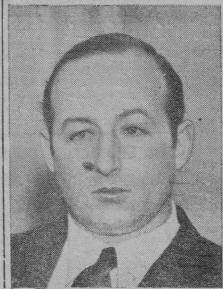
EL PRINCIPE STARHEMBERG, quien tras un largo proceso ha recobrado los enormes bienes de fortuna de su familia en Austria, resolución judicial que ha dado lugar a una verdadera "tormenta" política