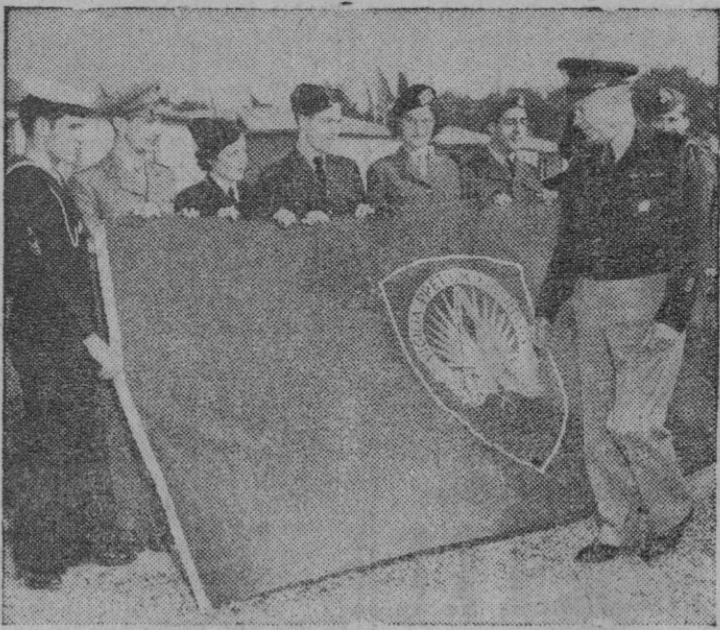
La nueva bandera verde y oro de la Organización del Pacto Atlántico fué izada recientemente por primera vez en Marley Le Roi (Francia), donde se encuentra el Cuartel general de Eisenhower