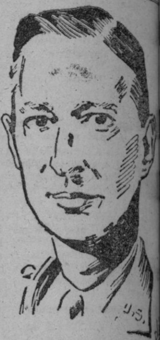
El general Clark

Esperará la actuación del Senado acerca de dicho nombramiento