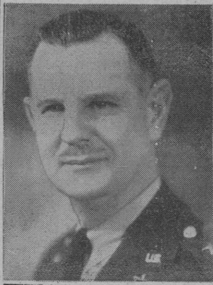
El general George E. Stratemeyer, jefe de las fuerzas aéreas americanas en Corea

Los tanques de las fuerzas comunistas del Norte avanzan por la carretera Seul-Taejón