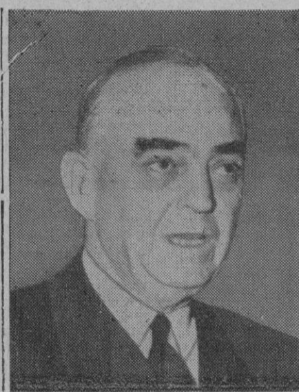
El almirante Thomas C. Kinkaid, jefe de la flota americana del Océano Pacífico

Cuartel General norteamericano en Corea, 7 (4 t.).—El Presidente de Corea del Sur ha dicho en un mensaje dirigido al pueblo del Norte de Corea, que sus hermanos los coreanos del Sur están deseosos de verlos pronto libre de la esclavitud comunista. En el mensaje dió a entender que le agradaría que los norteamericanos llevasen las operaciones militares contra Corea del Norte más allá del paralelo 38, hasta las fronteras septentrionales de Corea. Rhee predice en su mensaje que dentro de unos días las fuerzas de tierra, mar y aire aliadas, harán que el enemigo