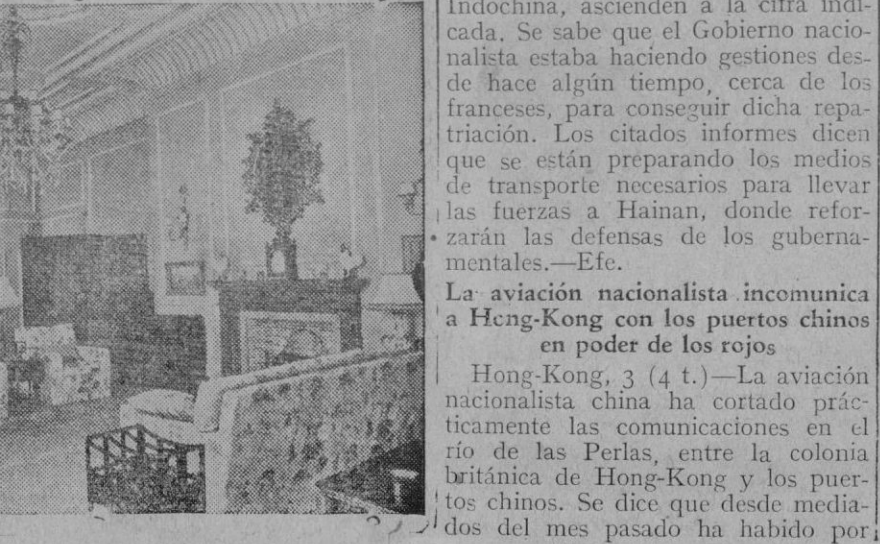
Con los regalos de boda Cuarto de estar de la princesa Isabel de Inglaterra, en Clarence House, donde reside. Está decorado con los regalos que recibió de todo el Imperio en ocasión de su boda