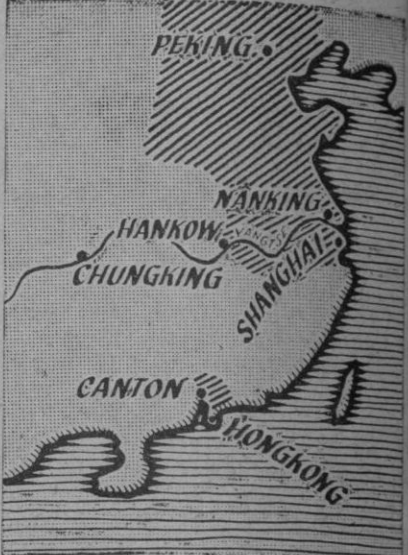
Gráfico de la China suoriental, en la que aparecen Pekín, actual capital de la China comunista; Cantón, cuya capitalidad nacionalista ha sido transferida a Chungking, en la que ha quedado establecida la sede del Gobierno de Chang Kai Chek. Cantón, como es sabido, se encuentra a virtualmente en poder de las fuerzas rojas

San Francisco, 14 (6 t.).—Con 1.105 refugiados a bordo entró en este puerto el buque norteamericano «General Gordon», procedente de Shanghai. Se trata de ciudadanos de 37 nacionalidades que huyen de los comunistas chinos. Entre los evacuados figuran varios diplomáticos, hombres de negocios, judíos y otras personas que vivían en China desde hace muchos años.—Efe.