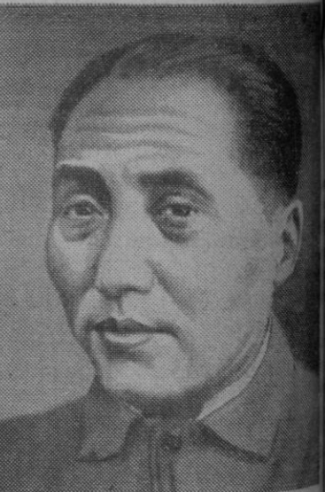
Mao Tse Tung, jefe del Estado chino comunista

Hoy se anuncia la presentación de una moción en la que se deplorará la actuación del Gobierno socialista en los asuntos económicos y financieros, «que culminó en la devaluación de la libra»; se predecirá que el resultado inevitable de la desvalorización es el aumento del costo de la vida y la amenaza de paro, y comprometerá al partido conservador a apoyar todas las medidas necesarias para «reestablecer el crédito nacional, eliminar la dilapidación y la extravagancia y salvaguardar el sistema de servicios sociales y el nivel de vida del pueblo».—Efe.