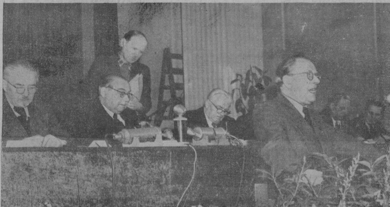
Dirigentes comunistas alemanes en una reunión pública, en la que se trató de la formación del Gobierno alemán rojo en el Este

Erlín, 4 (5 t.).—Los jefes políticos alemanes de la zona de ocupación soviética y las autoridades rusas, están celebrando conversaciones secretas en el sector Este de Berlín, mientras se aceleran los planes para la formación de un Estado comunista alemán oriental, según manifiesta la agencia United Press. Se dice que han sido llamados a Berlín, para estas conversaciones, los principales políticos de la zona soviética.